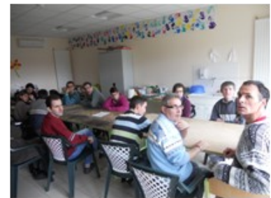
Les 2 groupes lors de la réunion résidents du 28 février.